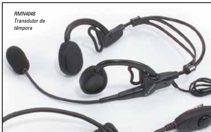
RMN4048 Transdutor de t mpora