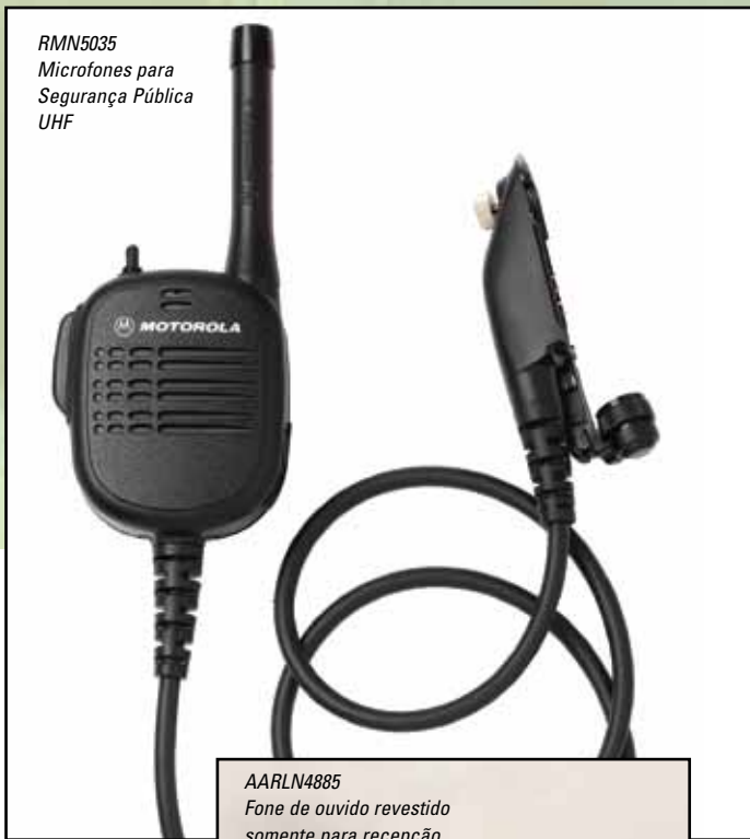
RMN5035 Microfones para Segurança Pública UHF