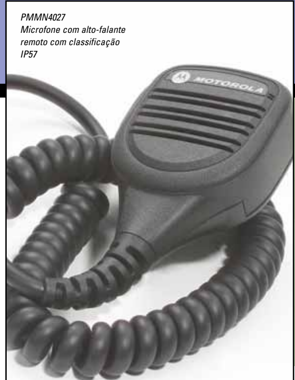
PMMN4027 Microfone com alto-falante remoto com classificação IP57