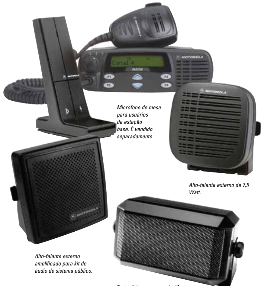
Microfone de mesa para usuários da estação base. É vendido separadamente.