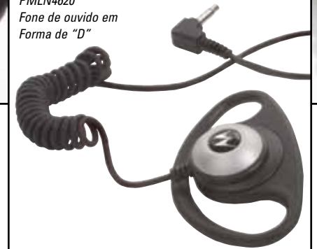
Uma entrada de fone de ouvido no microfone permite que o usuário receba áudio quando usado com os seguintes fones