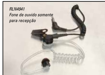
RLN4941 Fone de ouvido somente para recepção