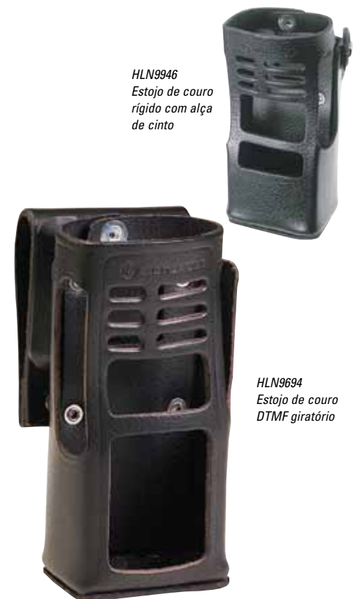
HLN9946 Estojo de couro rígido com alça de cinto