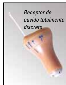
Receptor de ouvido totalmente discreto

O fone de ouvido totalmente discreto é fácil de usar. Simplesmente remova o fone de ouvido de qualquer Kit de Vigilância Motorola padrão de 2 ou 3 fios e conecte no colar, que fica facilmente oculto sob a roupa. O pessoal de segurança poderá usar este receptor minúsculo confortavelmente por horas seguidas!