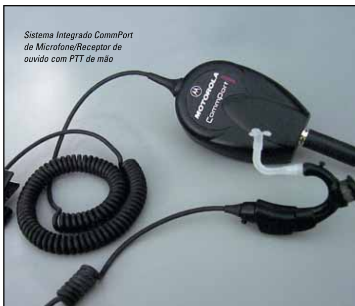
Sistema Integrado CommPort de Microfone/Receptor de ouvido com PTT de m o