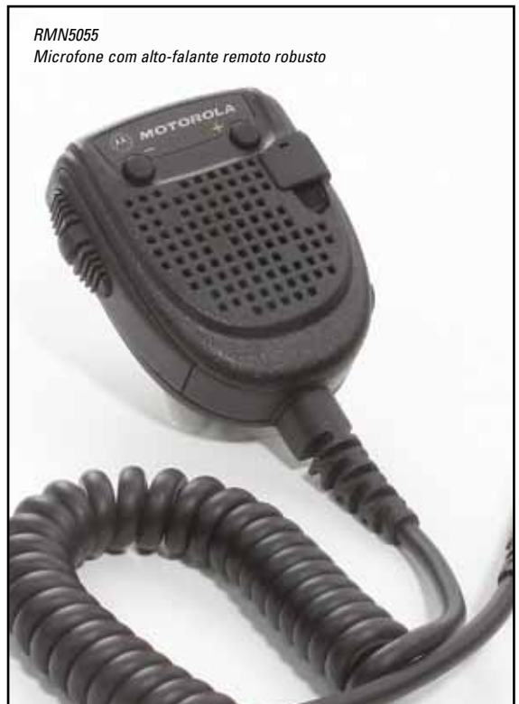
RMN5055 Microfone com alto-falante remoto robusto