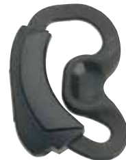
0180300E25 Proteção de ouvido com alça ajustável