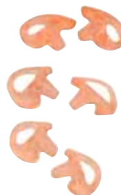
Da esquerda para a direita, de cima para baixo:

RLN4760 Auricular pequeno — orelha direita RLN4761 Auricular médio — orelha direita RLN4762 Auricular grande — orelha direita RLN4763 Auricular pequeno — orelha esquerda RLN4764 Auricular médio — orelha esquerda RLN4765 Auricular grande — orelha esquerda