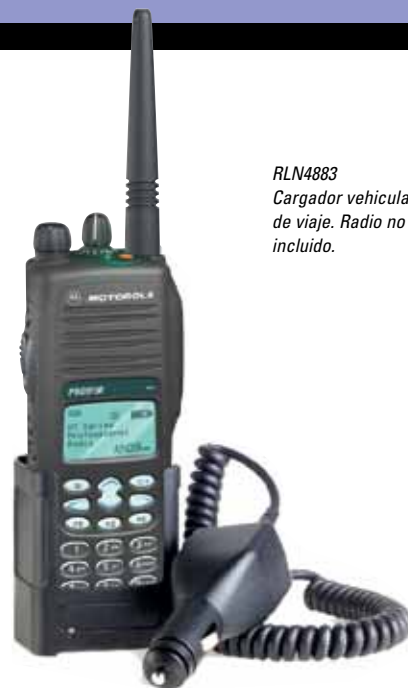
RLN4883 Carregador veicular de viagem. Rádio no incluído.

ENLN4103 Adaptador de antena VHF, 136-174 MHz ENLN4104 Adaptador de antena UHF, 403-470 MHz GMN6146 Microfone móvel de mão ENLN4117 Kit conector veicular WALN4078 Kit de espaçador de bateria 8264934B01 Software de programação 6881093C78 Manual do usuário 6881093C79 Manual técnico