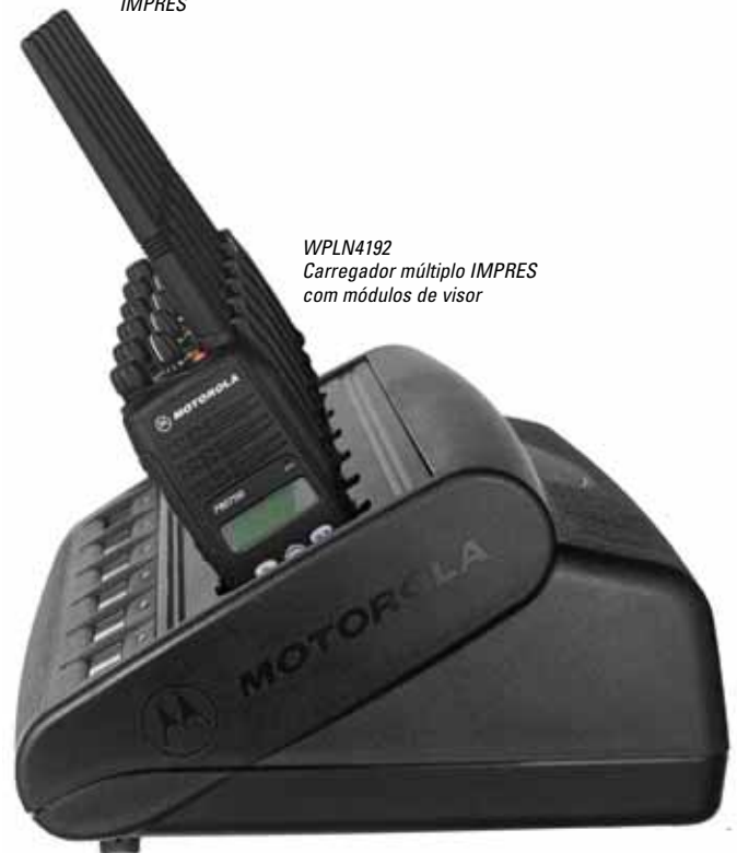
WPLN4192 Carregador múltiplo IMPRES com módulos de visor