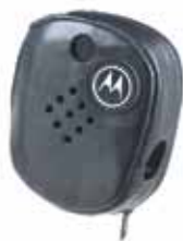
RLN5009 Capa de microfone