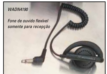
Fone de ouvido flexível somente para recepção