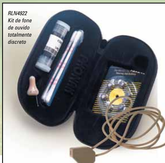
RLN4922 Kit de fone de ouvido totalmente discreto