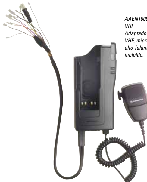
AAEN1006 VHF Adaptador veicular VHF, microfone com alto-falante remoto incluído.