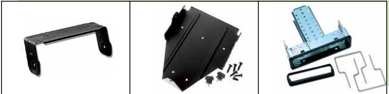
GLN7317 Suporte de montagem de perfil alto