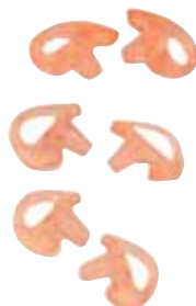
Da esquerda para a direita, de cima para baixo: