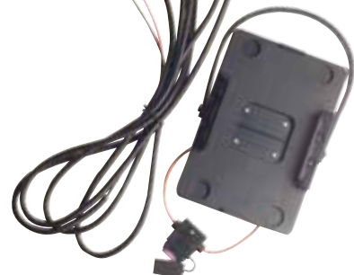
RLN4814 Suporte de montagem veicular e cabo de fio rígido