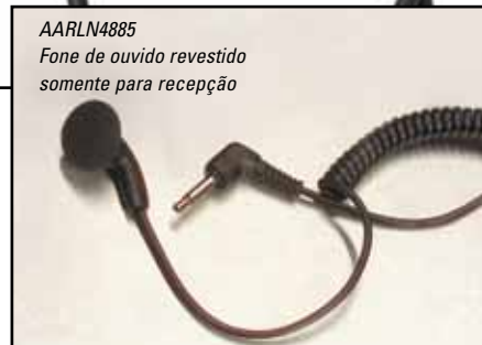
AARLN4885 Fone de ouvido revestido somente para recepção

Uma entrada de fone de ouvido no microfone permite que o usuário receba áudio quando usado com os seguintes fones