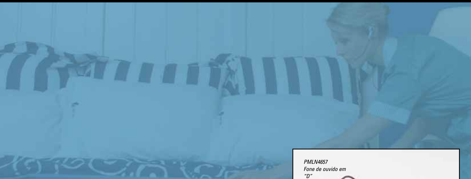
PMLN4657 Fone de ouvido em “D”

O fone de ouvido em forma de “D” é confortável e tem uma aparência elegante. Ideal para usuários nas indústrias de hotelaria, varejo, educação e equipes de segurança privada.