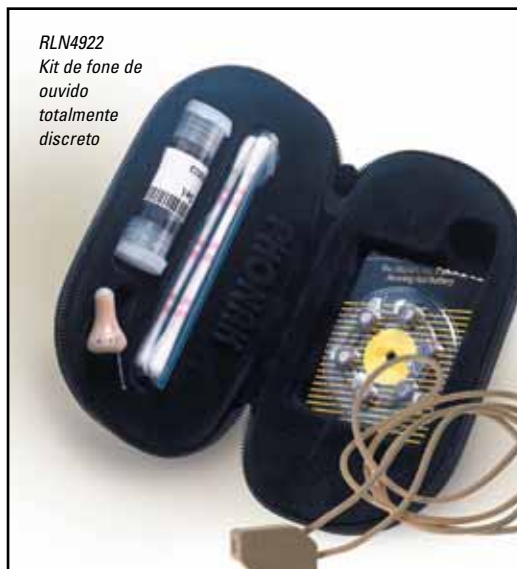
RLN4922 Kit de fone de ouvido totalmente discreto

O fone de ouvido totalmente discreto é fácil de usar. Simplesmente remova o fone de ouvido de qualquer Kit de Vigilância Motorola padrão de 2 ou 3 fios e conecte no colar, que fica facilmente oculto sob a roupa. O pessoal de segurança poderá usar este receptor minúsculo confortavelmente por horas seguidas!