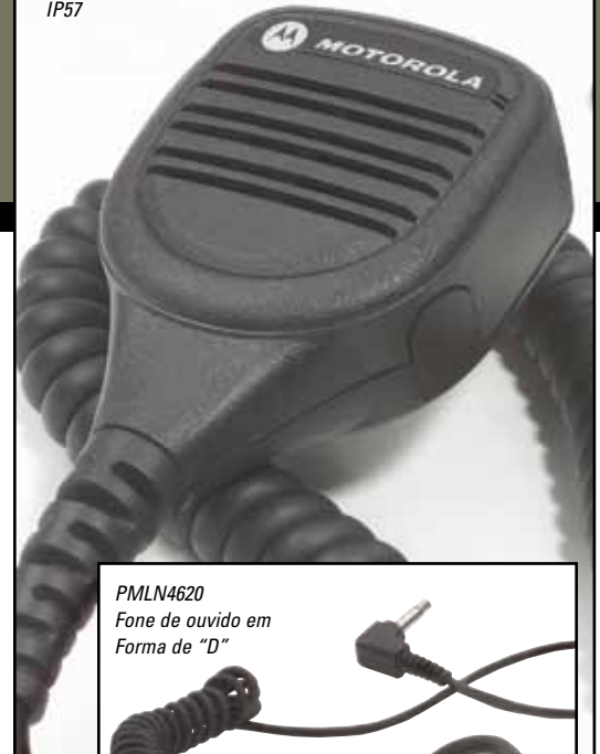
PMLN4620 Fone de ouvido em Forma de "D"