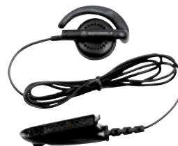
ENMN4013 Receptor de ouvido flexível

ENMN4013* Receptor de ouvido flexível 7580372E11 Almofada para ouvido em espuma de reposição