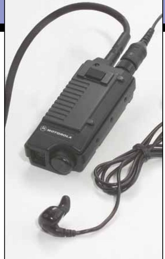
BDN6677 EMS com Módulo de Interface PTT