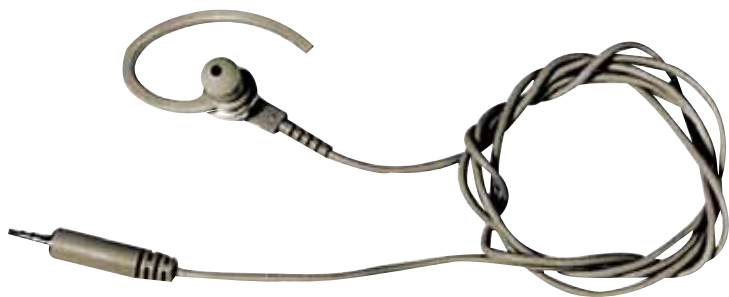
BDN6664 Fone de ouvido somente para recepção com um fone padrão