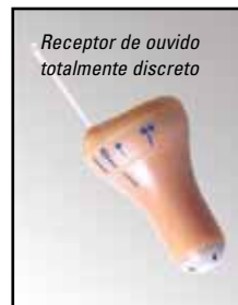
Receptor de ouvido totalmente discreto

O fone de ouvido totalmente discreto é fácil de usar. Simplesmente remova o fone de ouvido de qualquer Kit de Vigilância Motorola padrão de 2 ou 3 fios e conecte no colar, que fica facilmente oculto sob a roupa. O pessoal de segurança poderá usar este receptor minúsculo confortavelmente por horas seguidas!