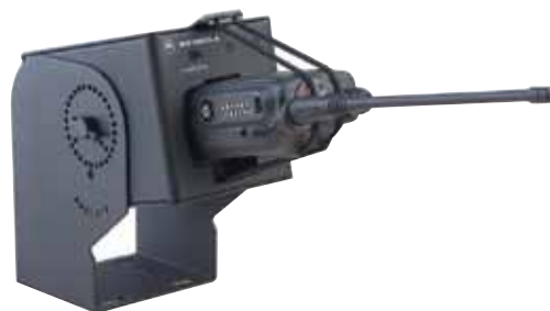
RLN5233 Carregador veicular