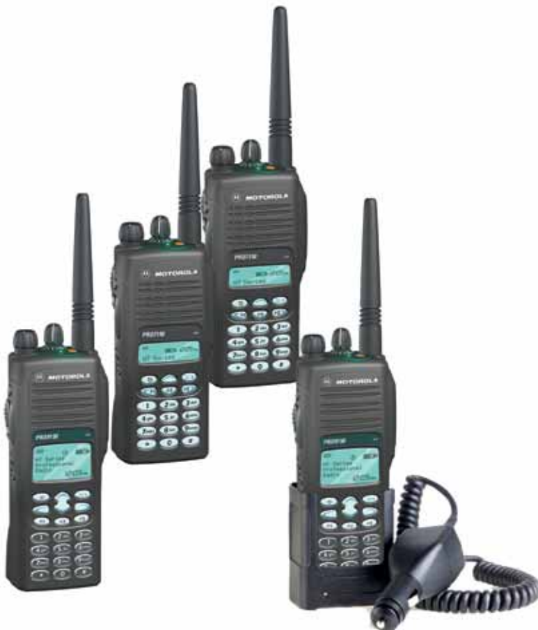
RLN4883 Carregador para viagem veicular. Rádios vendidos separadamente.