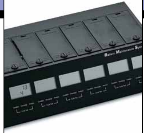
NDN4005 Sistema de manutenção de bateria baterias PLUS com 3 unidades