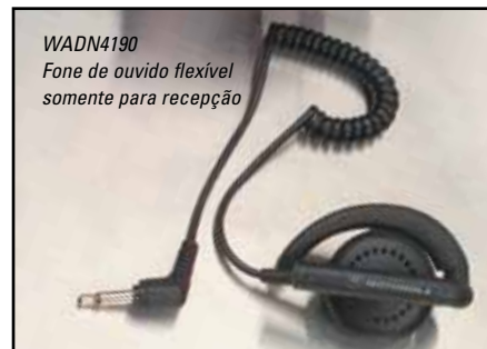
WADN4190 Fone de ouvido flexível somente para recepção