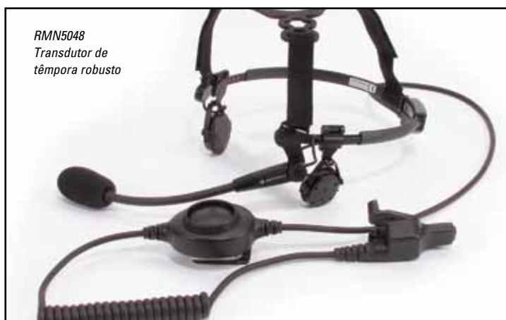
RMN5048 Transdutor de t mpora robusto