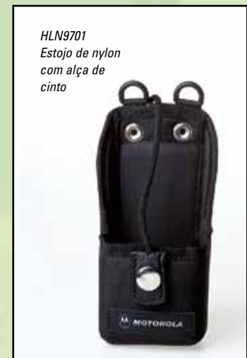
HLN9701 Estojo de nylon com alça de cinto