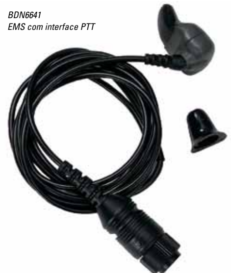
BDN6641 EMS com interface PTT