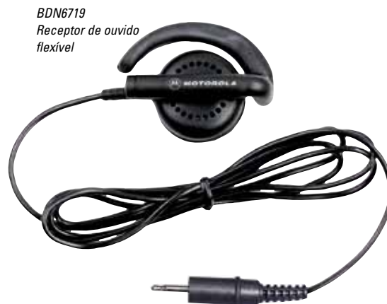
BDN6719 Receptor de ouvido flexível